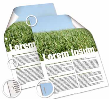
Zszywa i dziurkuje Twoje wydruki

Dla urządzeń MP C2050/MP C2550 opracowano unikalny wewnętrzny finisz na 500 arkuszy, który zszywa i dziurkuje wydruki. Dzięki świetnej jakości wydruków i szerokiej obsłudze mediów to doskonały partner w wydajnej pracy biurowej. Pamiętając o Twoim budżecie ograniczamy outsourcing dokumentów i produkcji profesjonalnie wyglądających dokumentów w firmie.