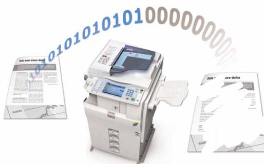
Nadpisywanie danych na dysku

Funkcje autoryzacji i szyfrowania służą do ochrony danych poufnych. Urządzenia MP C2050/MP C2550 są kompatybilne z opcjonalnymi pakietami bezpieczeństwa, takimi jak nadpisywanie danych na dysku twardym, zabezpieczenie kopiowania danych, autoryzacja kart i bezpieczne zwalnianie drukowania.