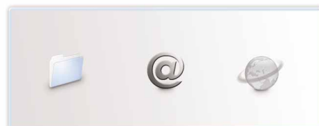
Skanuj do folderu, e-mail lub URL za pomoc 1 jednego przycisku